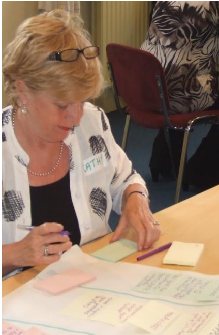
Thuas, ar clé: Breithniú ar ionchur ó na seisiúin pleanála lánpháirtíochta.