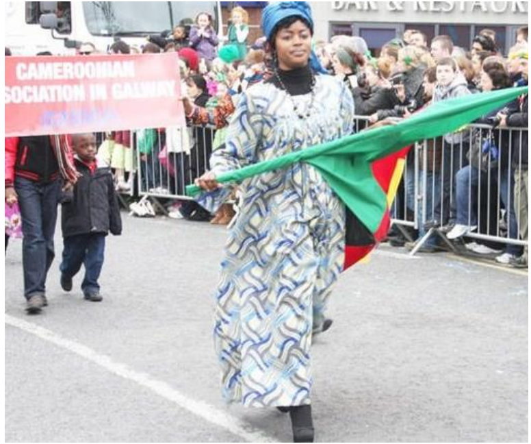
Thuas, ar dheis: Ag glacadh páirt i Mórshiúl Lá Fhéile Pádraig i nGaillimh.