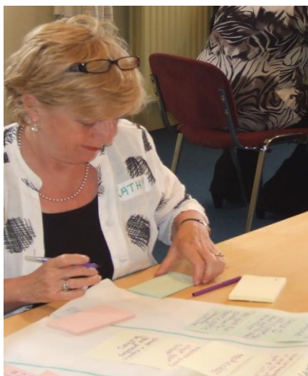
Na górze po lewej: Przegląd komentarzy dostarczonych na sesjach planowania integracji.