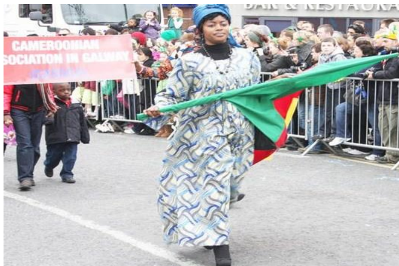
Na górze po prawej: Udział w paradzie z okazji obchodów Dnia Świętego Patryka w Galway.